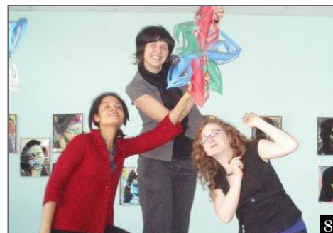
Équipe des études dirigées, école Chomedey-De Maisonneuve

Ce journal a été réalisé avec la collaboration de: