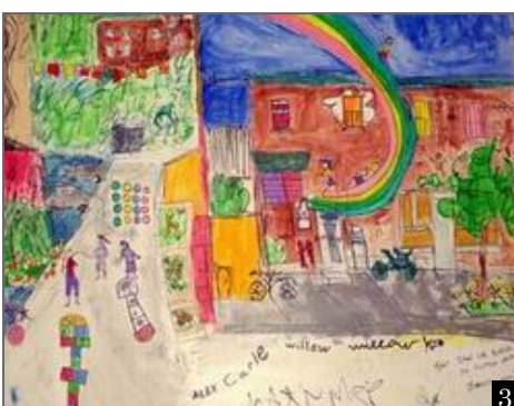
Fresque réalisée avec des jeunes de l'AED